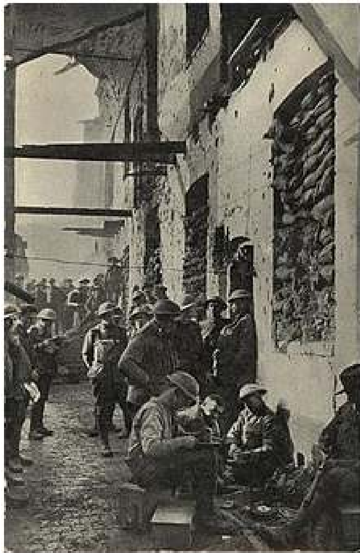
АВСТРАЛИЙСКИЕ СОЛДАТЫ В ИПРЕ, 1917 ГОД