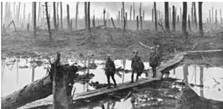
АВСТРАЛИЙСКИЕ АРТИЛЛЕРИСТЫ В ЛЕСУ ШАТО

Битва при Пашендейле стала символом солдатского страдания в ужасных условиях. Сражения проходили в болотистой местности, к тому же лето 1917 года выдалось холодным и дождливым. Войска с обеих сторон фактически «утонули в грязи» Пашендейля. Битва при Пашендейле унесла сотни тысяч жиз-