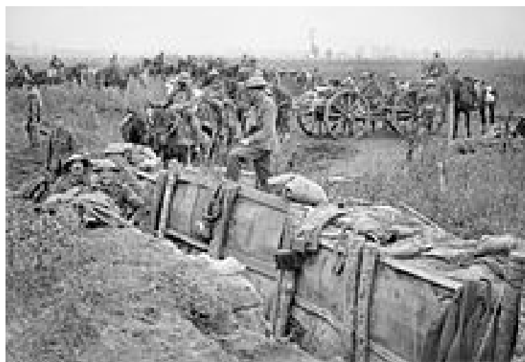
АНГЛИЙСКИЕ АРТИЛЛЕРИСТЫ ЗАНИМАЮТ НОВЫЕ ПОЗИЦИИ, 31 ИЮЛЯ

Германцы наносили чувствительные контрудары по прорвавшимся британским войскам. Однако германская армия также понесла большие потери, в основном, от огня британской артиллерии.