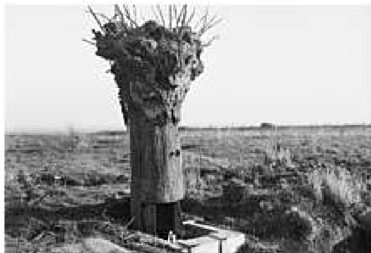
МАКЕТ ДЕРЕВА, КОТОРЫЙ ИСПОЛЬЗОВАЛСЯ АВСТРАЛИЙСКИМИ ВОЙСКАМИ КАК НАБЛЮДАТЕЛЬНЫЙ ПУНКТ

В ходе наступления англичане захватили в плен 7200 солдат и 145 офицеров, а также большое количество пулемётов. Операция завершилась 14 июня 1917 года.