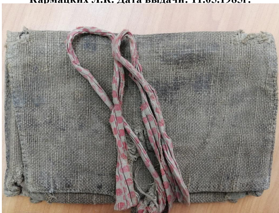
Кисет с фронта Кармацких Л.К.