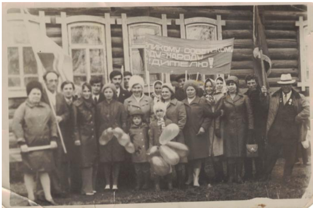
Коллектив Голышмановского мясокомбината на митинге, посвященном 9 мая. р.п. Голышманово. 1975 г.