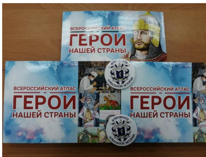
Всероссийский атлас «Герои нашей страны»