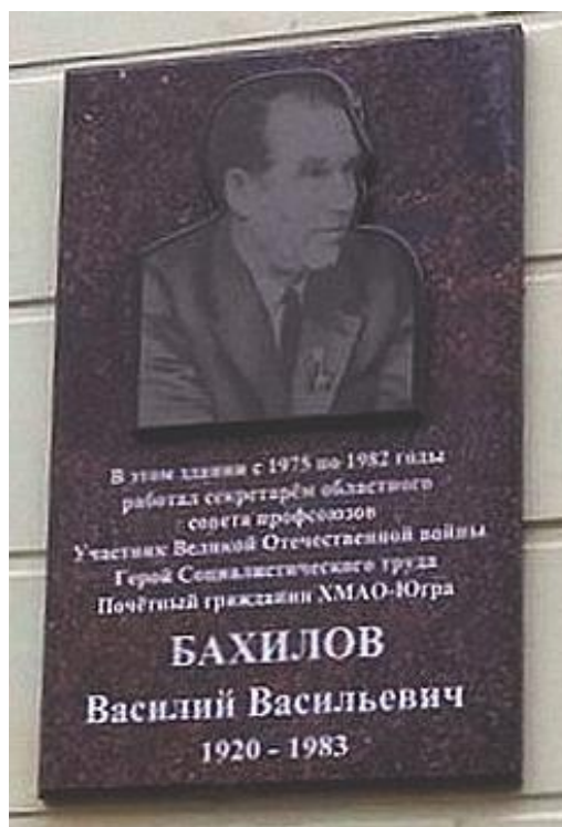
Мемориальная доска ул.Хохрякова, 50, г.Тюмень, установлена в 2017 г.