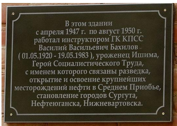
Мемориальная доска на здании бывшего Ишимского городского комитета (ул.Ленина, 39, г.Ишим), установлена 12 мая 2010 года