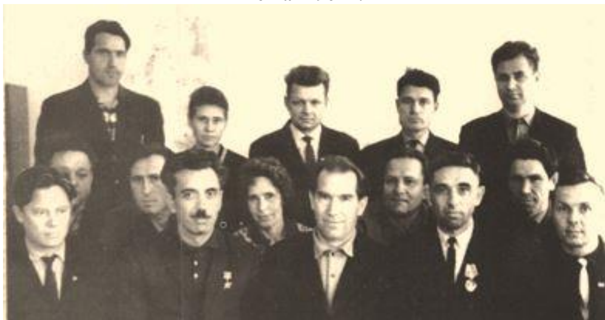
Фотография на память после вручения наград. 1966 г., г.Москва