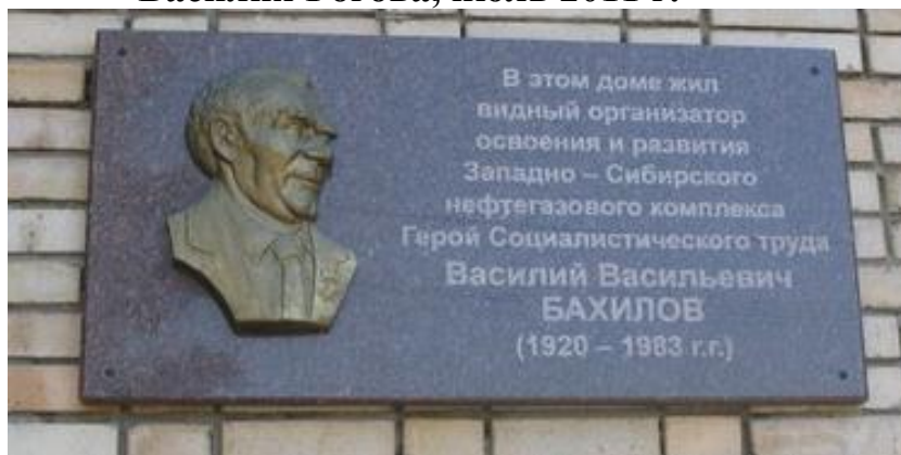
Мемориальная доска ул.Советская, 112, г.Тюмень, установлена 2000 г.