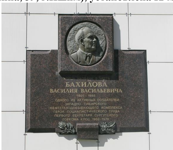
Аннотационная доска на доме ул.Бахилова, 3 в г.Сургуте. Фото Василия Рогова, июль 2011 г.